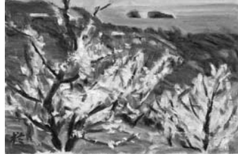
橋原健三『南紀梅林』1992年 油彩・キャンパス 24.4×33.5cm