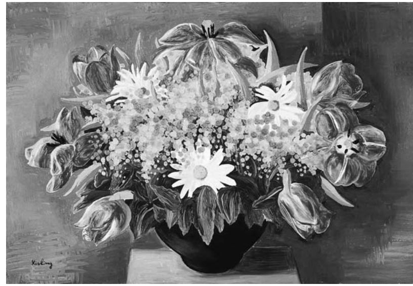
モイーズ・キスリング『花』1933年 油彩・キャンパス 38.1×55.1cm