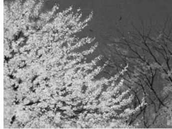
清水信行『春麗』1991年 岩絵具・紙 50.0×65.3cm