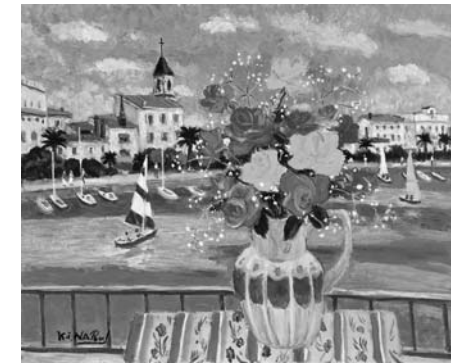
成井弘(ばら サナリー) 1991年 油彩・キャンパス 60.6×72.6cm