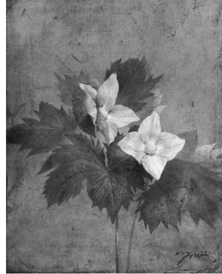
藤井勉『山路の春白根葵』2000年 油彩・キャンパス 35.0×27.3cm