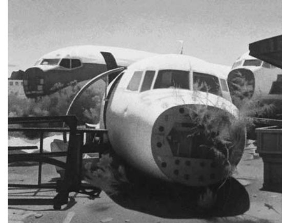
寺井力三郎《飛行機の墓場(アリゾナ)》2002年 油彩・キャンパス 162.2×194.0cm