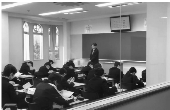
花咲徳栄高校の様子