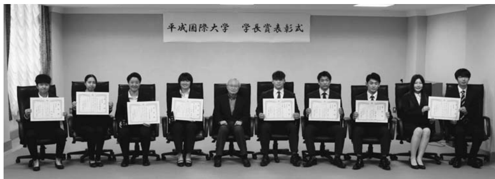
平成国際大学 学長賞表彰式