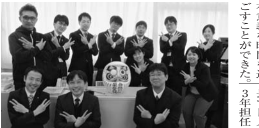
23期生にちなんだ「2」「3」ポーズ また保護者会合格祈願旅行でも湯島天神を参拝するなど、3年生を応援するイベントが行われた。