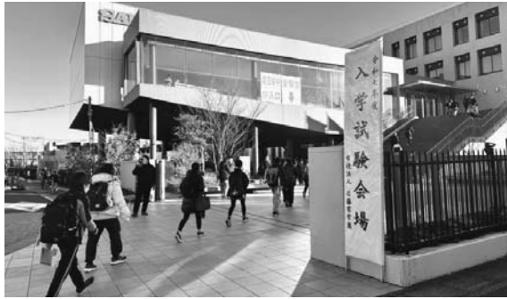
埼玉栄中学校の様子

本学園の中学2校、高校4校で、令和7年度の入学試験が1月に順次行われ、無事終了した。中学、高校を合わせ、全体で約2万8千人の出願者があり、昨年と比較してほぼ同数となった。例年出願者が1万人を超える栄東中学校を筆頭に、大規模な入試業務となったが、学園教職員の総力を結集し、円滑な運営を行うことができた。