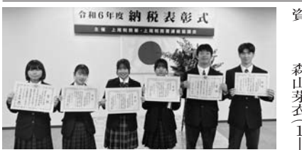
税に関する作文・税の標語入賞者