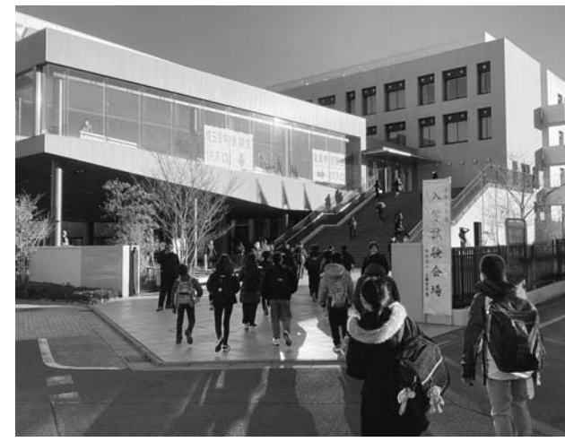
学クラスともに、勢いを増す埼玉栄中学校。入試という厳しい競争を勝ち抜き、本校に更なる勢いをつける。

1時間目の国語の試験が始まる合図で全員が一斉にスタート。受験勉強の成果を発揮すべく、それぞれが一心不乱に問題に取り組んだ。この後、算数・社会・理科へと試験は続き、午後には全ての科目が終了。保護者は別室で受験生を待つ間も、緊張した面持ちで待機していた。