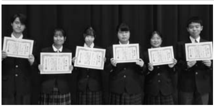
お〜いお茶新俳句入賞者