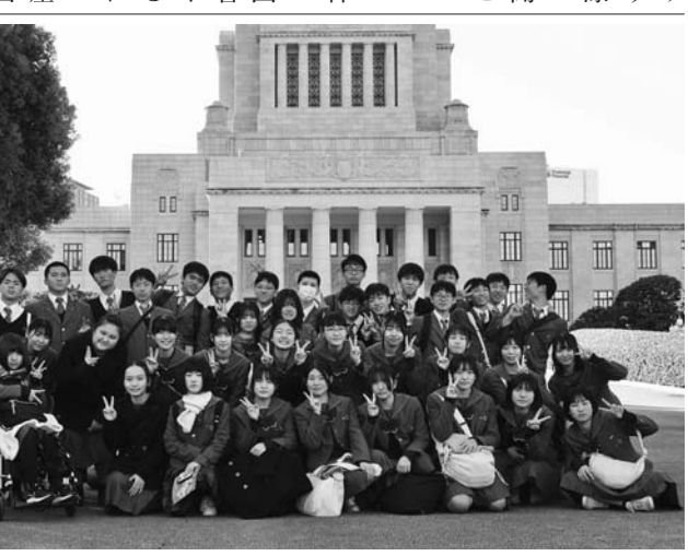
今回の学校行事を通して、生徒たちは自分が所属するコースの特性に応じた学校行事を体験することで「深い学び」につなげてくれた。ここから感じた興味や疑問などを大切に、今後の学びに活かして欲しい。

3年生がそれぞれ所属するコースで校外学習を実施した。医学クラスは帝京大学医学部、難関大クラスは官公庁、進学クラスはさいたま市宇宙劇場に行った。埼玉栄中学校では「サカエデーブラーニング」と称し、学校行事などの学校生活を通して、各教科等の特質に応じた「見方・考え