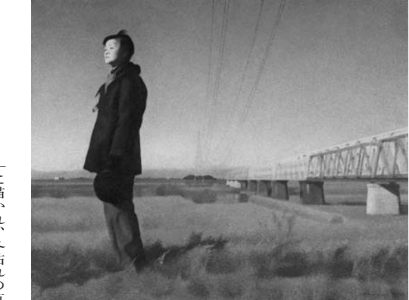
寺井力三郎《冬晴の利根川》2012年 油彩・キャンパス 130.3×162.0cm

埼玉県と群馬県の県境となる利根川に跨る東武鉄道の鉄橋と土手。画家・寺井力三郎が暮らし、創作活動を続けた羽生市内から望む景色である。青く澄み渡る空に浮かぶ電線が画面中央に描かれ、冬枯れの草木の前には黒いコート姿の女性が遠くに目を向けて立っている。寺井作品に幾度となく登場するこの鉄橋は、自身の散歩コースであったという。モデルとなった妻と共に、身近な日常の情景を題材にしたのが本作。「赤城おろし」と呼ばれる赤城山から凍てつく風の音さえ感じさせるような画面の中で、太陽に照らされ前を見つめる表情は、未来へと続くささやかな日常への敬慕と決意を想像させてくれる。