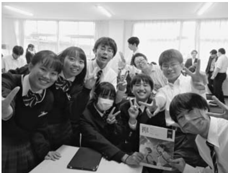
日本政策金融公庫職員による講評