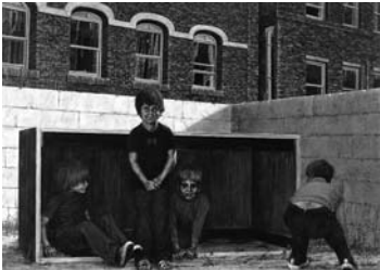
山本貞（U・S・A'73）1973年 油彩・キャンバス 162.4×227.3cm