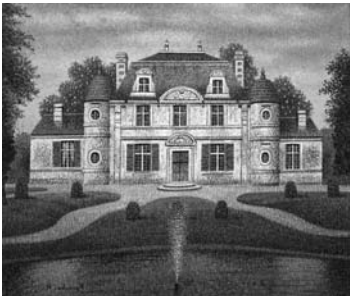
西村龍介（静日）1992年 油彩・キャンバス 45.7×53.1cm