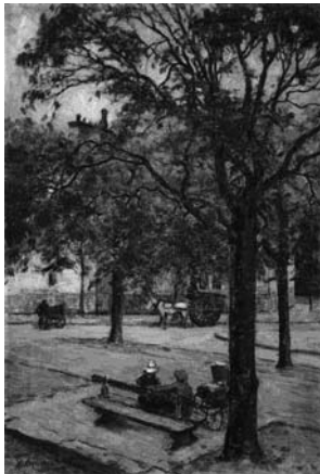
跡見泰（灯りともし頃）1922-24年 油彩・キャンバス 67.8×46.0cm

今回は、紙上特別企画展として『旅立ちの季節』と題した内容にて特集する。 3月は卒業や進級など人生の節目となる大きな転機を迎える人々も多い。慣れ親しんだ環境から、新たな生活へと歩みを進める季節とも言えるであろう。多くの芸術家たちも多様な文化や価値観を求めて、海外に留学・遊学して創作活動に挑んでいる。渡米・渡仏し 今回は、紙上特別企画展として『旅立ちの季節』と題した内容にて特集する。フランスの田舎を巡る画題とした大津鎮雄、広大なアメリカを横断しイメージを膨らませた山本貞など、枚挙に暇が無いほどの芸術家たちが食欲な好奇心と向学心を抱いて海外に旅立ったのである。 本コーナーでは、佐藤栄太郎の彫刻作品『旅立ち』からイメージを広げ、海外をモチーフに描いた7名のものがある。