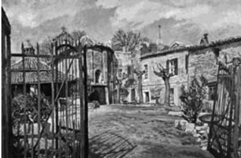
大津鎮雄（教会のある庭）1988年 油彩・キャンバス 130.3×193.9cm