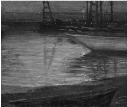
田中保（港と海岸）1917-19年 油彩・キャンバス 48.2×56.0cm