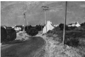
渡邉武夫（ぶるたにゆ新秋）1988年 油彩・キャンバス 49.8×72.5cm