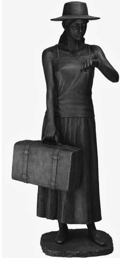
佐藤栄太郎《旅立ち》1999年 ブロンズ 175.0×60.0×30.0cm

や待合せの時間を気にする素振り、鑑賞者に旅愁に満ちた物語を想起させる作品である。「旅」をテーマにした本作は、新しい世界へと果立つ若人の夢や希望だけでなく、緊張や不安さえも表現しているようだ。 本学園の創設者・佐藤栄太郎（1928―2008）は、半生をかけて彫刻家として