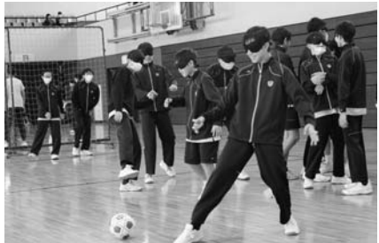
ブラインドサッカー