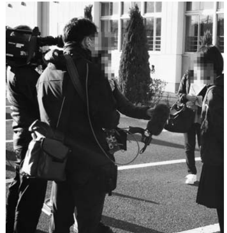
NHKのインタビューに答える受験生

合否の結果は全てホームページで発表。本校はインターネット出願から始まり、発表まで、全てホームページ上で行われたが、特に大きな混乱もなく無事終了した。今年の志願者総数は11年連続で1万人を超え、過去最高の1万4千16人となった。ますます栄東入試は激戦りになる中、受験生たちの熱気あふれる姿勢は、栄東の新しい未来を予感させた。