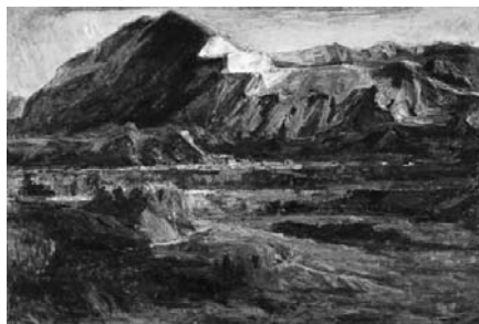
磯村敏之 (武甲山) [秩父] 1983年 油彩・キャンバス 112.2×162.0cm