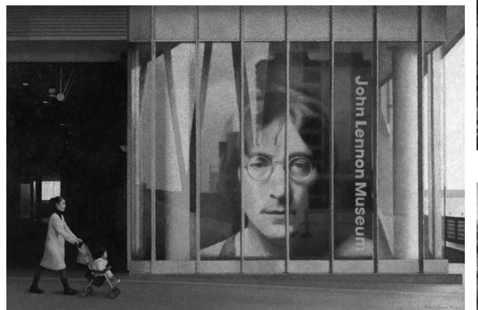
寺井力三郎 (IMAGINE)【さいたま新都心】2007年 油彩・キャンバス 130.3×194.0cm