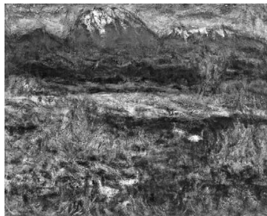
齊藤英一 (冬到来) [加須・利根川] 2004年 油彩・キャンバス 130.4×162.0cm