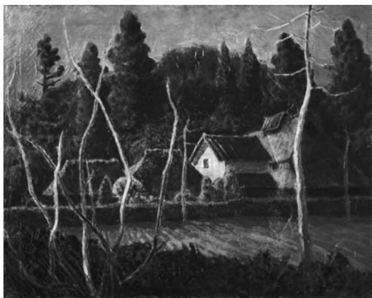
玉之内満雄 (早春) [日高] 1948年 油彩・キャンバス 72.6×91.0cm

●紙上展ミニ解説 『今月の一点』 寺井力三郎 《IMAGINE》 今回も紙上展覧会より寺井力三郎の《IMAGINE》と題された作品を紹介する。 絵のモチーフとなっているのは、JRさいたま新都心駅前にあった「ジョン・レノン・ミュージアム」である。2000年にジョン・レノンを記念する世界初の常設ミュージアムとして「さいたまスーパーアリーナ」に開館し、ライセンス契約満了を以て10年後に閉館した。本作では同館のエントランスに掲げられた世界的な音楽家であるジョン・レノンの大きな肖像写真をメインに描かれており、開館から7年を経て街を象徴する施設となった同館の存在感を伝えている。 点描技法による寺井独特の淡く臍気な絵画世界は、私たちの記憶の曖昧さとも相俟って、心地よく移ろいゆく時代への懐かしさと空しさを感ぜさせてくれる。