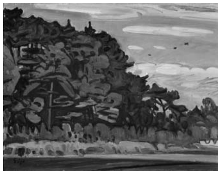
奥瀬美三 (武蔵野の秋) [浦和・三室] 1959年 油彩・キャンバス 31.6×40.6cm