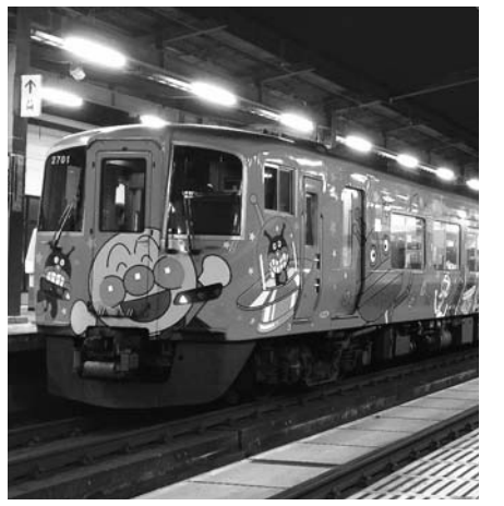
アンパンマン列車で四国一周！！

で骨組みの制作を効率的に行いました。今年度は文化祭は新型コロナウイルスの影響に伴い1か月程延期されたものの、7月下旬、4年振りに一般の方を迎えて開催できました。