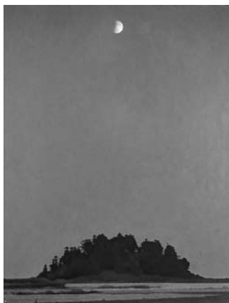
寺井力三郎 (月と古墳) [行田] 1975年 油彩・キャンバス 145.6×112.3cm