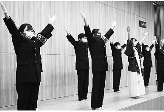
埼玉栄高校リモートでの壮行会