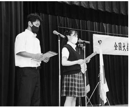
花咲徳栄高校壮行会