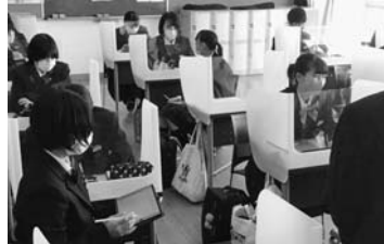
タブレットを活用しての授業

ICT環境の整備 昨年実施された休校に 対応するため、オンライン 授業の構築を全国に先駆け 行うことができたが、さ らにICT環境の整備を進 めている。電子黒板機能付 きのプロジェクターやスク リーンを各教室に配備し、 映像やデジタル教材を利用 しての授業が行われている。 パソコンやタブレットの整 備も行き、リモートによる 全体集会やディスカッション、 プレゼンテーションな ども可能になり、より授業 の効率化、習熟度が増して いる。