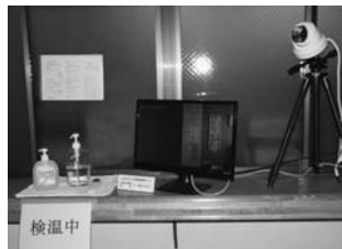
学園本部受付のサーモグラフィー