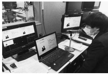
リモートでの配信