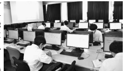
パソコン設置の教室

ICT環境の整備 昨年実施された休校に 対応するため、オンライン 授業の構築を全国に先駆け 行うことができたが、さ らにICT環境の整備を進 めている。電子黒板機能付 きのプロジェクターやスク リーンを各教室に配備し、 映像やデジタル教材を利用 しての授業が行われている。 パソコンやタブレットの整 備も行き、リモートによる 全体集会やディスカッション、 プレゼンテーションな ども可能になり、より授業 の効率化、習熟度が増して いる。